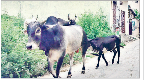
सांपला। सड़कों पर घूम रहा बेसहारा गोवंश।