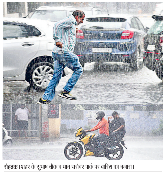
रोहतक। शहर के सुभाष चौक व मान सरोवर पार्क पर बारिश का नजारा।