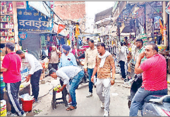
रोहतक। अवैध अतिक्रमण हटाते नगर निगम की टीम ।